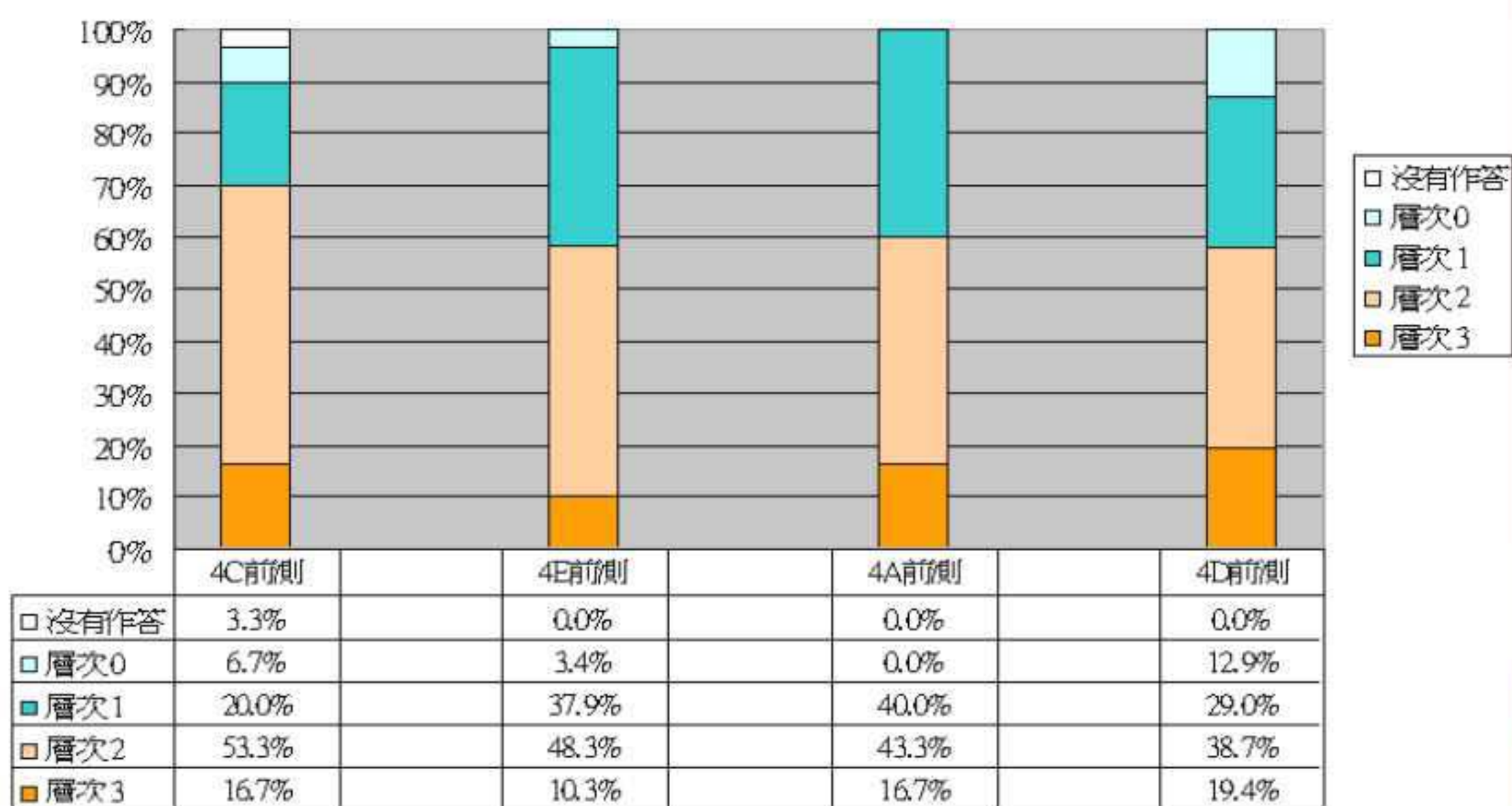
第三題：作者在第二段中「緊緊地拿」一件校服時，反映她的心情如何？何以見得？