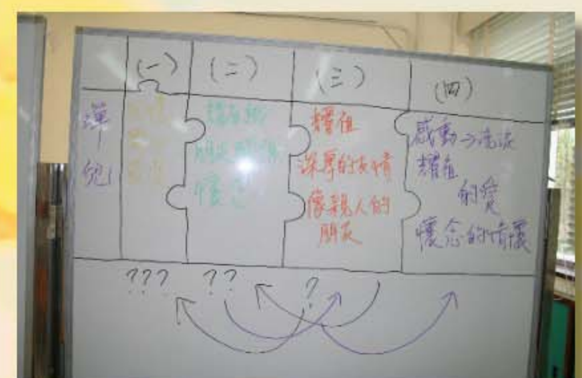
第四輪教學：黑板處理