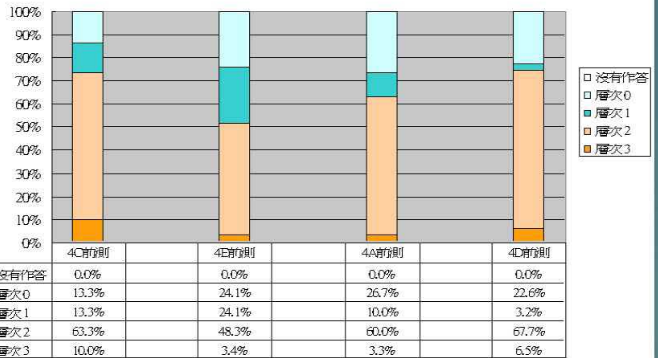
第二題：為何媽媽臨死之前，要「費力地抓住我的校服」？