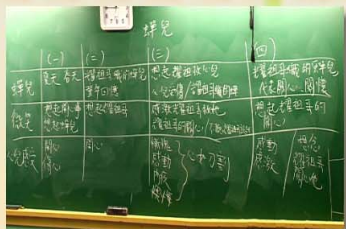
第三輪教學：黑板處理