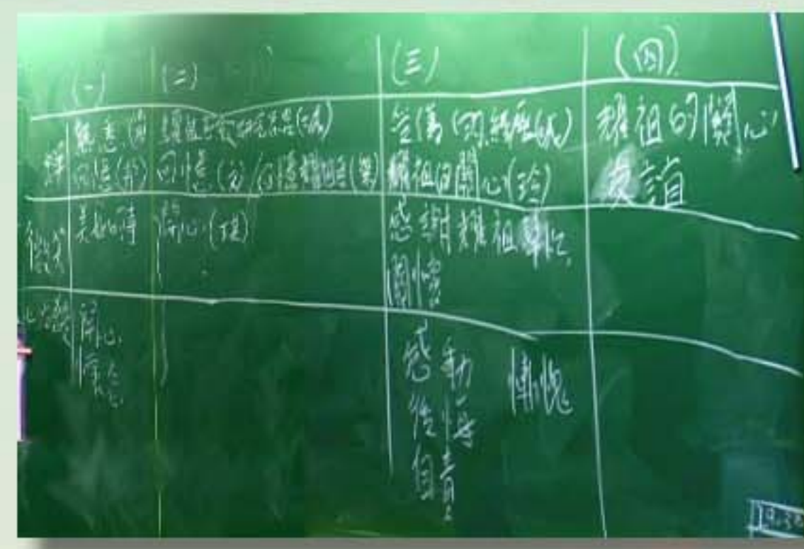
第二輪教學：黑板處理