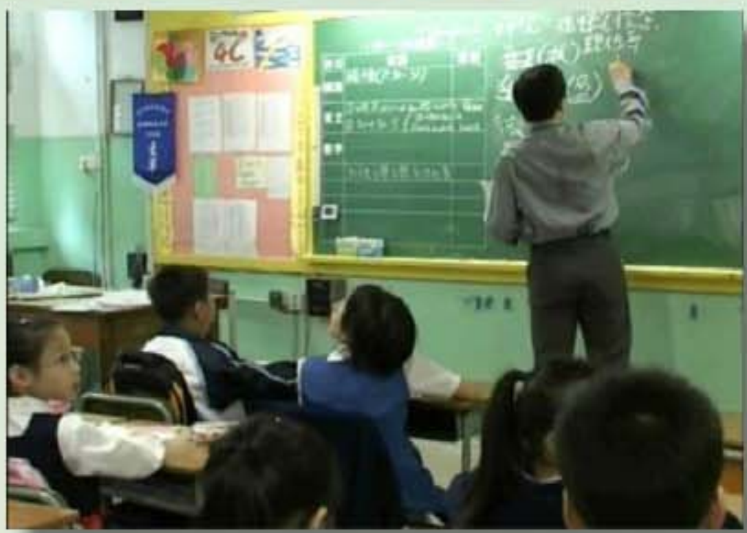
第一輪教學：黑板處理