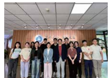
到访青岛中国海洋大学及山东大学