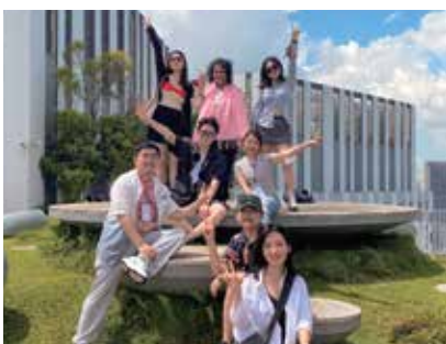
新加坡组屋考察团