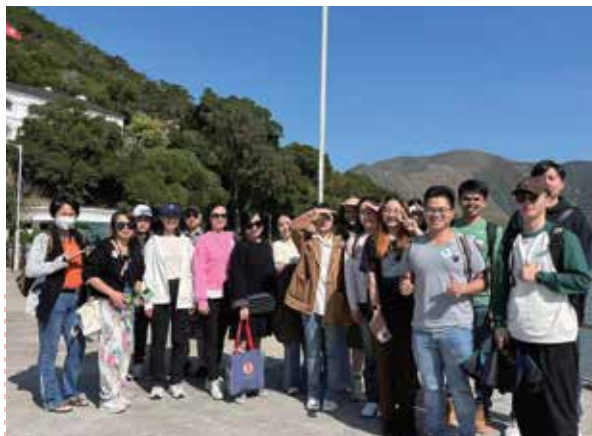
生态导赏：大澳渔村