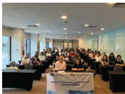
小组实地研究成果展示