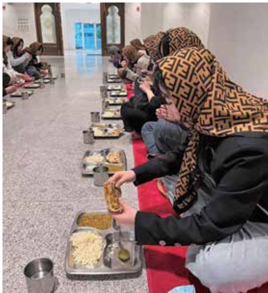
社区考察：锡克教庙