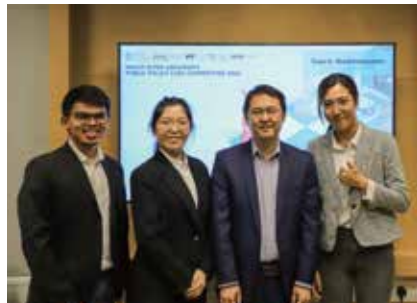
香港科技大学公共政策案例分析大赛