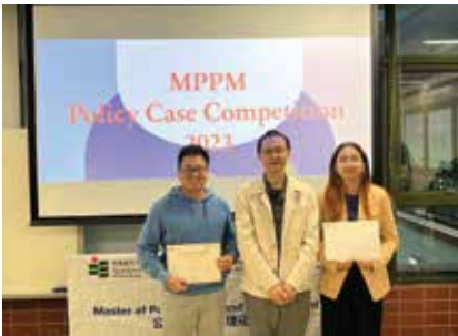
MPPM公共政策案例分析大赛