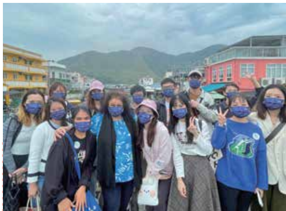
生态导赏：大澳渔村