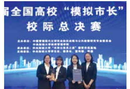
第九届全国高校大学生“模拟市长” 大赛蝉联桂冠