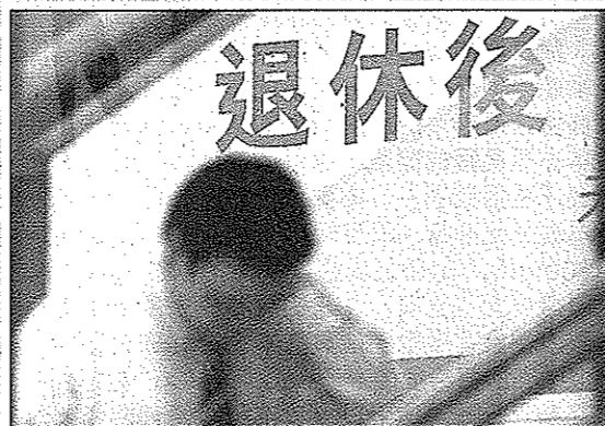
筆者指出，人口老化問題愈趨嚴重，延長退休年齡以紓緩問題是有可能。

第二是生產力的問題，當人口老化的時候，長者撫養比率（工作年齡人口與長者人口比例）便會愈來愈大。據估計香港長者撫養比率會由2011年的333增至2041年的645。換句話說，勞動人口的減少亦會令整體社會的生產力減低。要解決這兩個由人口老化衍生的問題，延遲退休年齡或許能一石二鳥，起舒緩的作用。