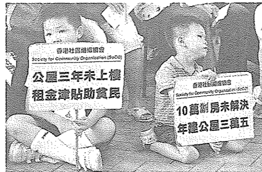
香港不少貧窮家庭中，兒童不單居住環境惡劣，更談不上可接受優質教育。

這個介入的有效性已經被三個大型的隨機分派臨床試驗研究所肯定，筆者知道香港亦有兒童發展先導計劃(現名為兒童身心全面發展服務)和兒童發展基金先導計劃，但是它們的深度和有效性都不及以上所述的兩個「及早介入」。筆者希望重設的扶貧委員會能夠深入研究這些介入的好處和它們在香港推行的可行性，因為這方向才是解決貧窮兒童問題的正道，和避免跨代貧窮的不二法門。