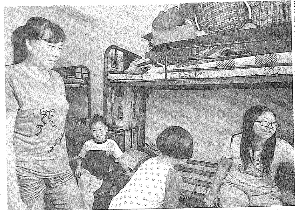
因為家庭貧窮關係，不少學童輸在學習起跑線上，導致有跨代貧窮的問題。

為什麼我們特別關心貧窮兒童的問題呢？其中一個最主要的原因是它可能導致跨代貧窮的問題。外國研究顯示貧窮兒童的確會因他們匱乏的成長環境而令他們輸在起跑線上，怎樣才能夠令他們與其他兒童有同等的機會(Equal Opportunity)，那「及早介入」學習計劃，不讓貧童輸在起跑線，正是其中一個打破跨代貧窮的方法。