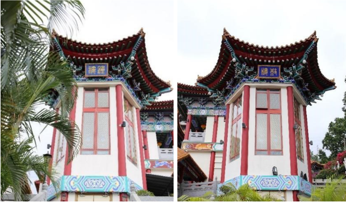
位於中軸綫兩旁平衡對稱的鐘樓和鼓樓