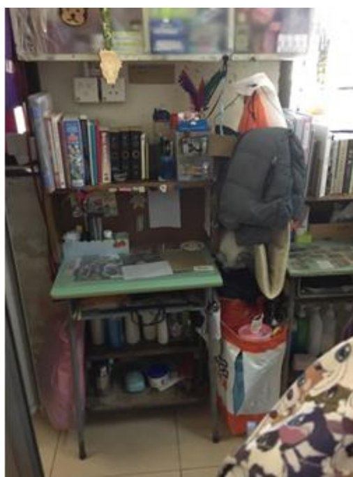
學生的書桌，簡樸而充實。 家具都是別人捐贈／拾回來的。