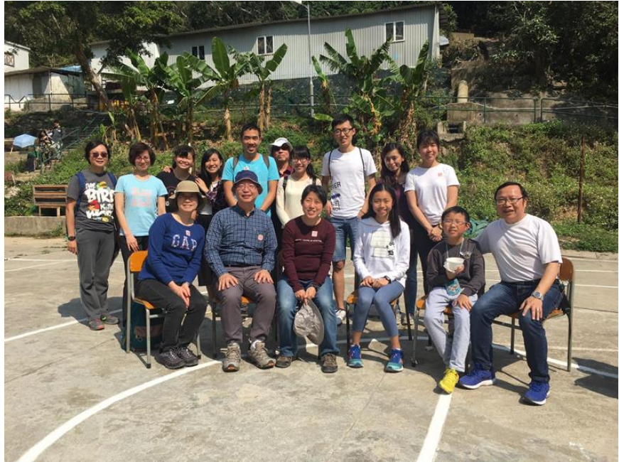
教大參加者大合照