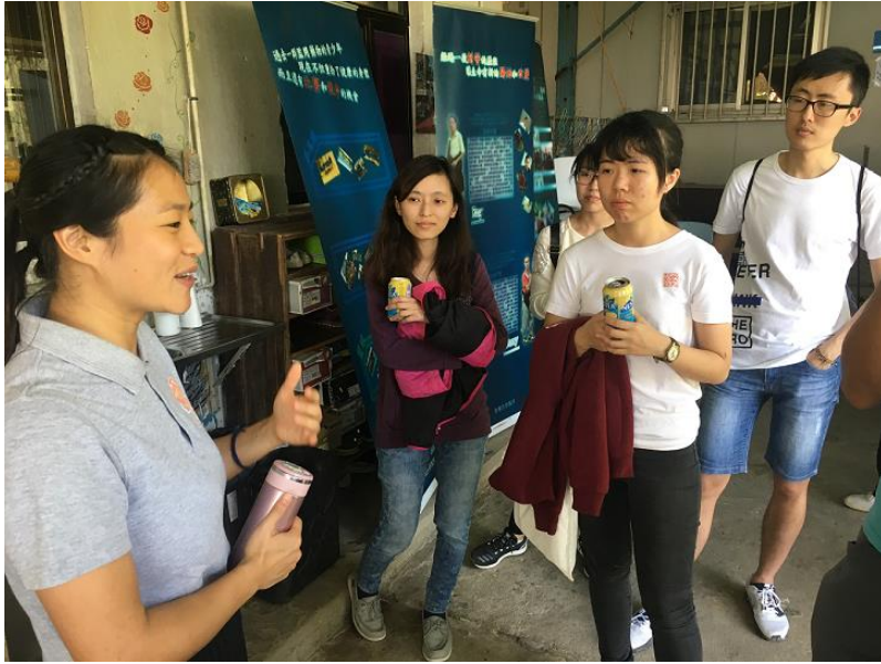
年青的老師為我們講解同學的日常生活