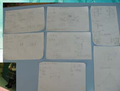
信箱設計圖 及我們的信箱