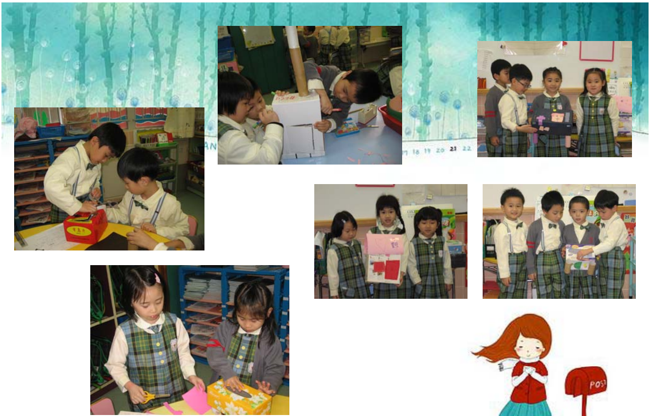
幼兒按著設計圖製作信箱，完成後向問同學介紹自己信箱的特別！